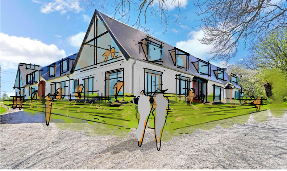
Nye boliger i avlsbygninger

Et unikt boligprojekt, hvor historien og charmen fra en gammel landbrugsejendom kombineres med moderne, bæredygtigt byggeri. Vi ønsker at omdanne en klassisk forlænget landbrugsejendom til et nyt boligfællesskab bestående af 12-14 stilfulde rækkehuse, skabt med respekt for stedets historie og omgivelser.