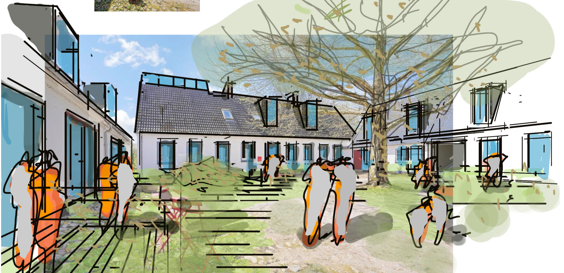
Gårdsplads med ankomst til nye boliger